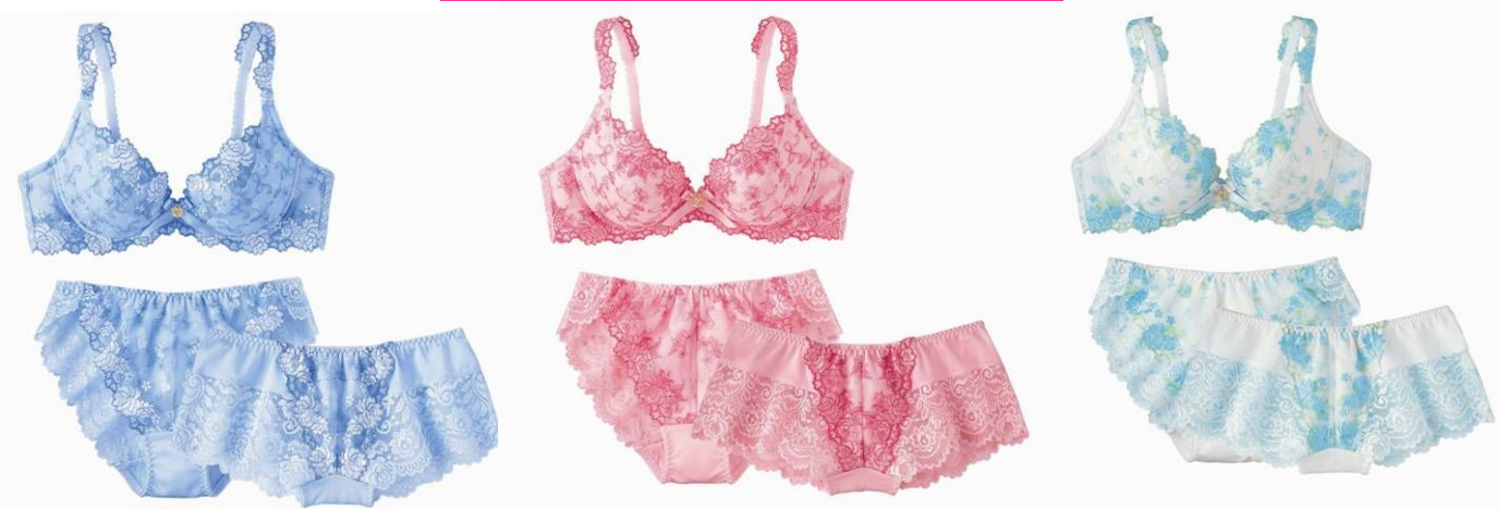
リラックスをくれるサックス