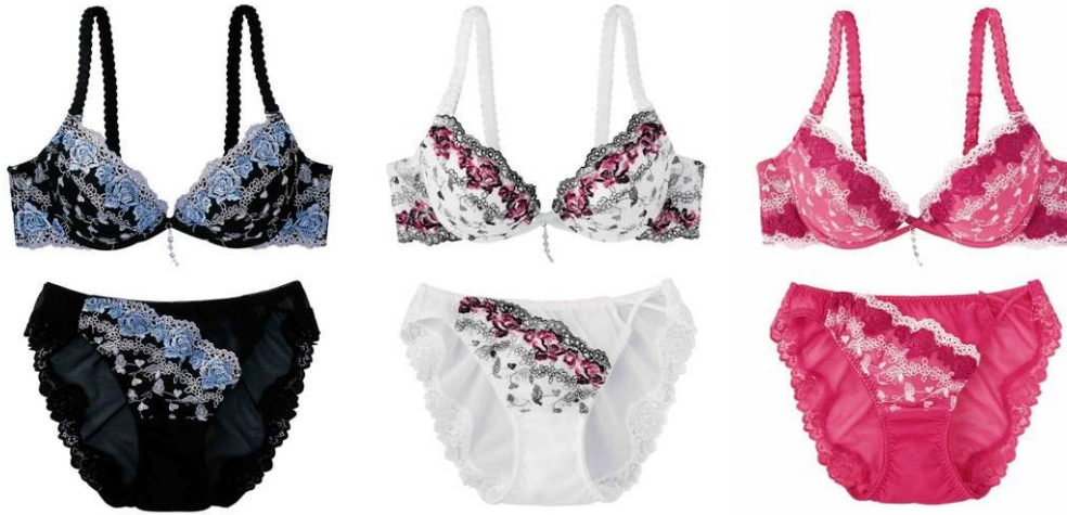
個性的で大胆な ブラック